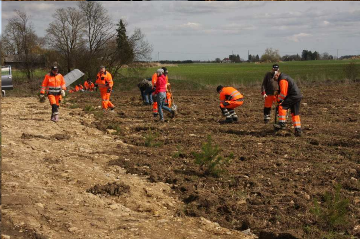
Slaid 7 - 30.05.2018 KNT XXXI keskkonnapäev